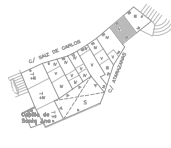
PLANTA DE ORDENACION