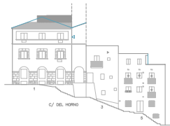
C/ DEL HORNO