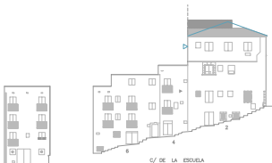
C/ DE LA ESCUELA